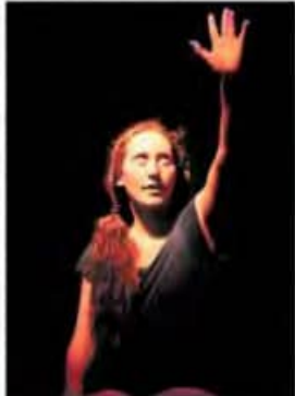
"TEJER TENDRÁ LA VIEJA ESPAÑA" CON LA COMPAÑÍA TEATRO MIA.

El programa de actividades se realizó en el teatro en Gorbea, el punto que se paró de un circuito internacional sudamericano que próximamente se realizará en Chile.