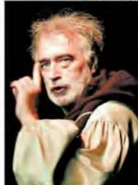
"CANTOS DE LA VIEJA ESPAÑA" CON LA COMPAÑÍA TEATRO MIA.