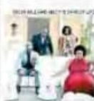
LA REUNIÓN EN LINA