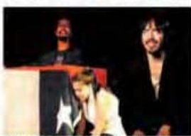
TEATRO: "EL TARTARU CALACA". COMPAÑÍA: CAJAL

Collipulli trabaja para tener una Corporación Cultural Municipal