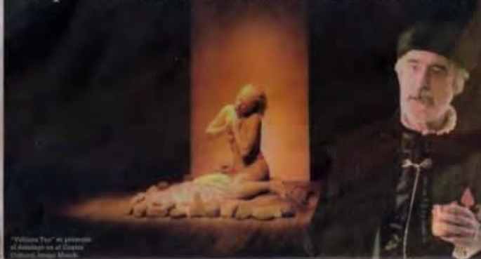
"Yo, Quevedo, con perdón" en presentación en el Club de la Unión, Teatro del Mundo.

El lenguaje corporal y los monólogos de época han sido algunas de las sorpresas en el Encuentro de Teatro del Mundo, que se realiza en el Club de la Unión, con el objetivo de fomentar el interés por estas actividades y promover el uso de los espacios culturales de la zona.