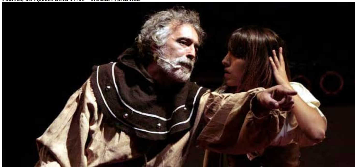
Un momento de la representación 'Cuentos de la vieja España'.

Martes, 28 Agosto 2012 17:05 | RUBÉN MADRID