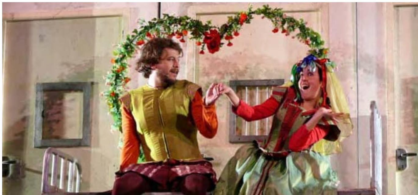
Representación en Italia de 'Los locos de Valencia'.

Pero el contrato es estable y esta última primavera, por ejemplo, han ofrecido nada menos que 48 pases de una de las obras que tienen en cartel, 'Los locos de Valencia'. Por eso cada año Escarramán viaja a Italia desde que en 2009 llevaron allí su