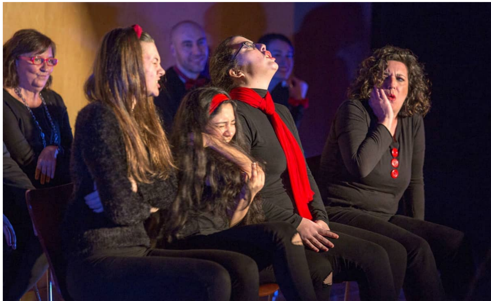
Los alumnos de este centro 'amateur' protagonizaron el jueves una de las muestras abiertas al público que ponen en escena a lo largo del curso en la sala Tragaluz del Teatro Auditorio.

INMACULADA LÓPEZ | GUADALAJARA i.lopez@latribunadeguadalajara.es